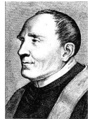
St. Klemens M. Hofbauer