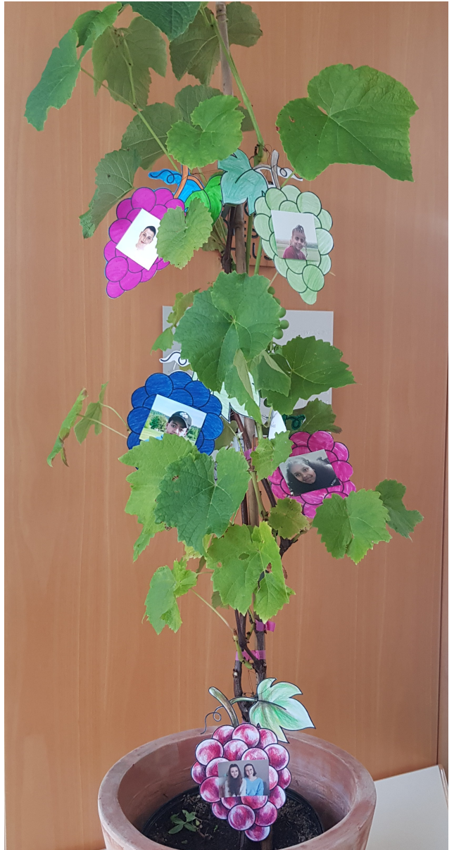
Foto: Ein echter Weinstock mit echten Reben und symbolischen Reben (Grafik mit Fotos). Ein Geschenk der Treysaer Ministranten.

Jesus sagt: Ich bin der Weinstock, ihr seid die Reben. Wer in mir bleibt, der bringt reiche Frucht. (Joh 15,5)