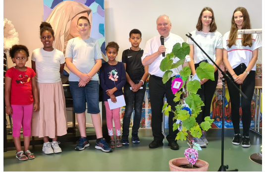
Gratulation von Verwaltungsrat und Pfarrgemeinderat und den Ministranten