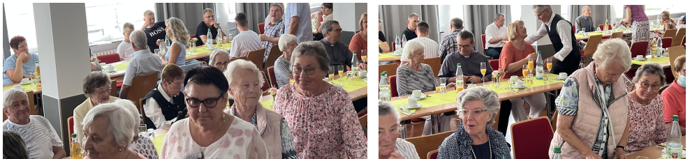
Viele Gäste und eine fröhliche Stimmung im Dorfgemeinschaftshaus Zimmersrode.