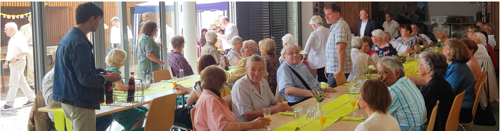
Zahlreiche Gemeindemitglieder und Gäste feierten im Pfarrheim mit