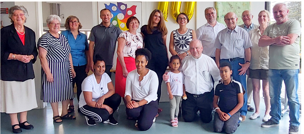
Viele Helfer sorgten für ein fröhliches Gemeindefest und für gute Stimmung