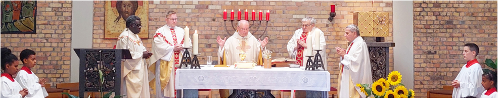
Dankmesse: Lasset uns danken dem Herrn, unserem Gott!